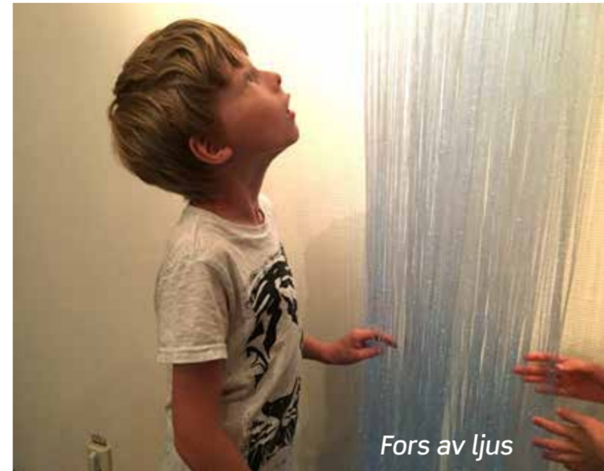
Fors av ljus

Man kan sitta runt den sensoriska elden och vila sina sinnen.