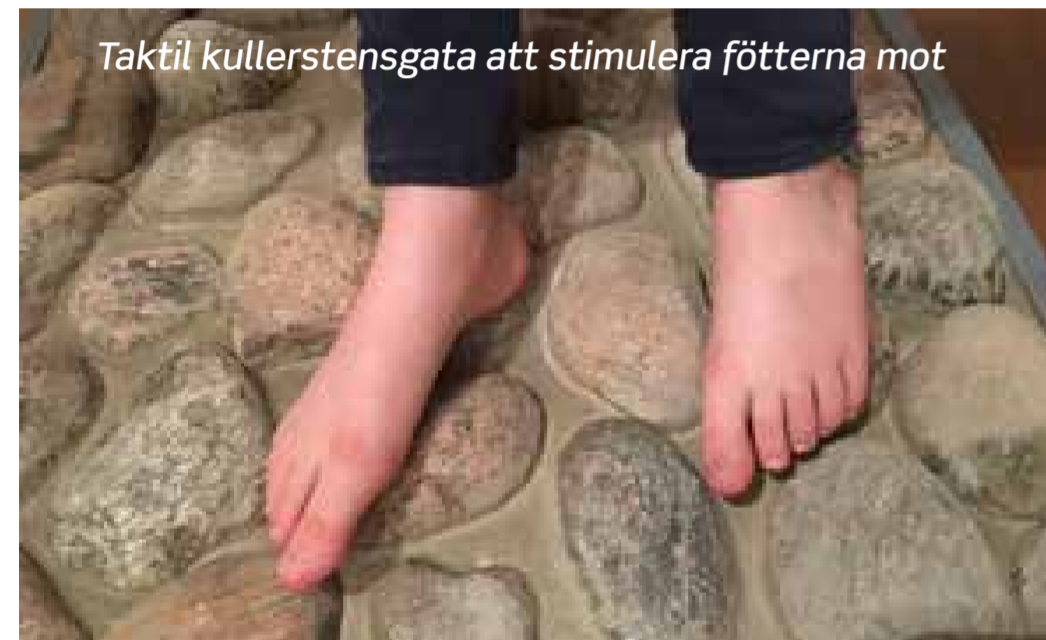
Taktill kullerstengsgata att stimulera fötterna mot

Den sensoriska ljusforsen som faller nedför berget skiftar i olika färger. Du kan ändra färg med hjälp av knappar. Vilken färg tycker du vattnet ska ha?